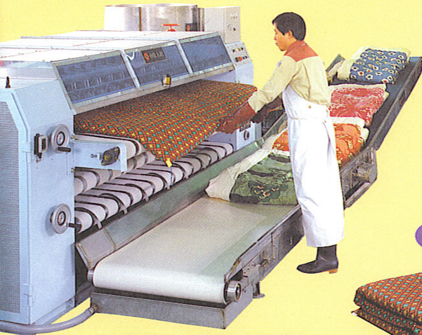
●全自動フトン丸洗い処理装置

毎日寝ているフトン気になりませんか？ フトンの中綿には発汗作用によるいろいろな汚れがしみ込み、体温と湿度で雑菌が繁殖しやすくなっています。そこで、丸洗い専用の機械で水洗いします。石油系クリーニングではありませんのでニオイ等の心配もありません。清潔なフトンで健康な生活を送りましょう。